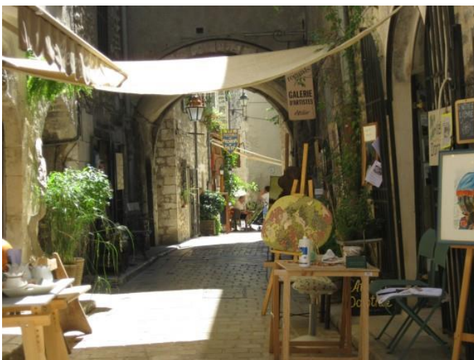
Gasse in der Altstadt von Vence mit Künstlerateliers